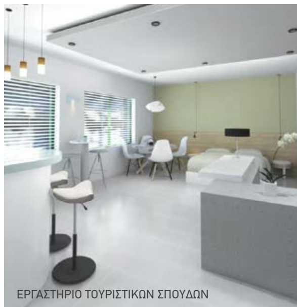
ΕΡΓΑΣΤΗΡΙΟ ΤΟΥΡΙΣΤΙΚΩΝ ΣΠΟΥΔΩΝ